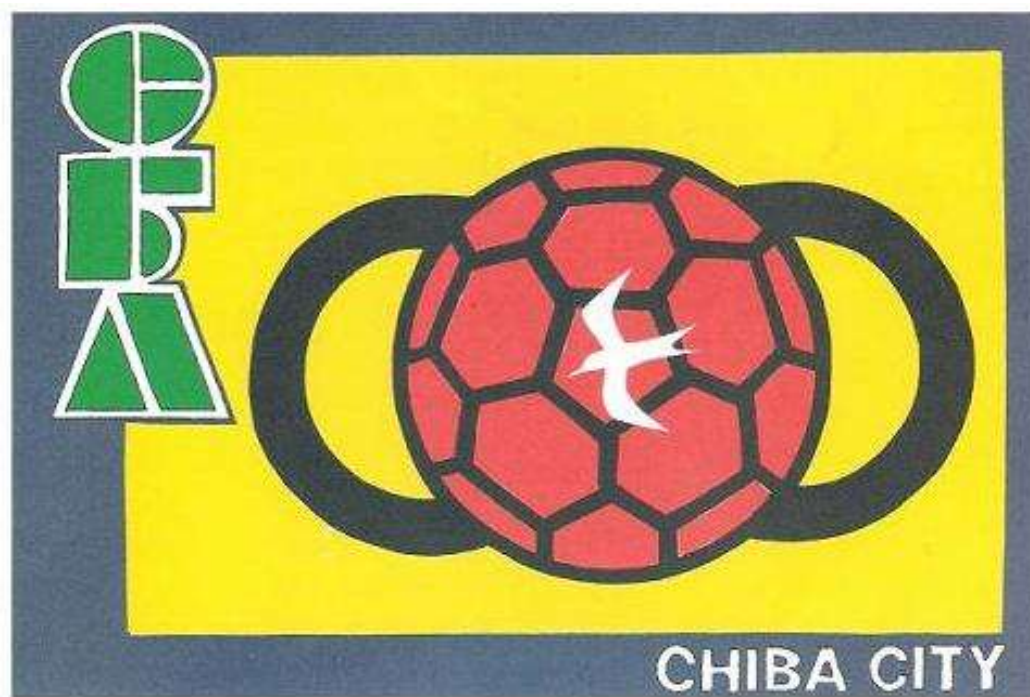
(千葉市サッカー協会旗)

主 催 千 葉 市 サ ッ カ ー 協 会 共 催 千 葉 市 教 育 委 員 会 主 管 千 葉 市 サ ッ カ ー 協 会 第 4 種 委 員 会 緑 区 サ ッ カ ー 協 会 第 4 種 委 員 会 後 援 太 陽 日 酸 株 式 会 社